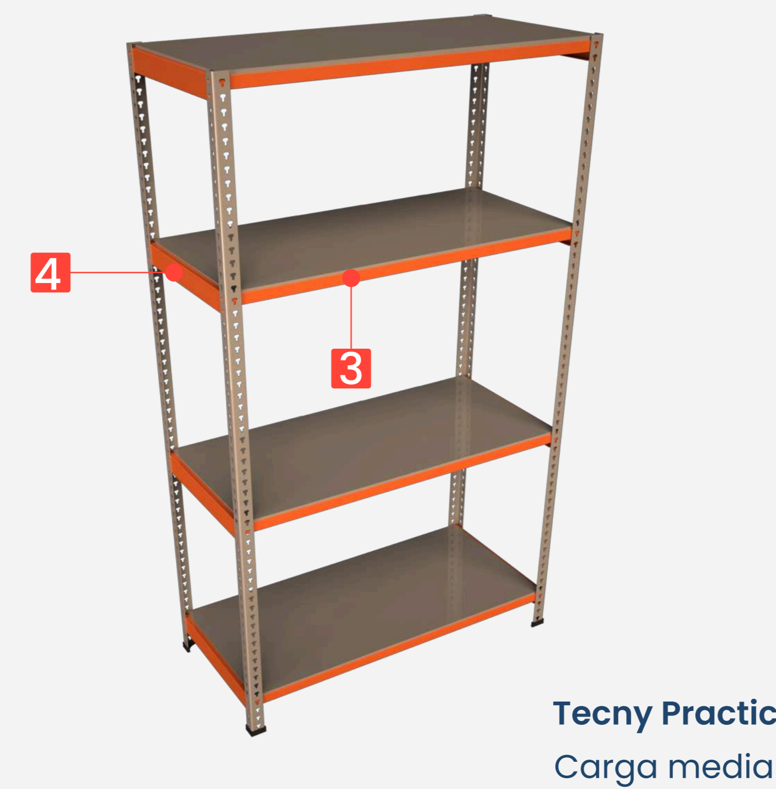
Tecny Practic Carga media