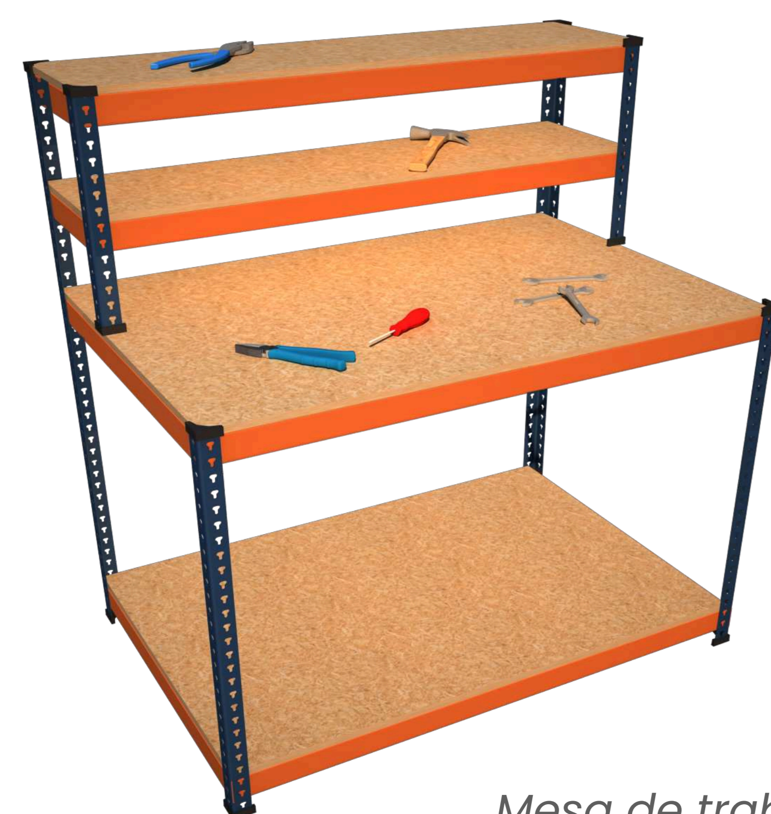
Mesa de trabajo

Escanea el código QR para saber más sobre las Mesas y Bancos de trabajo