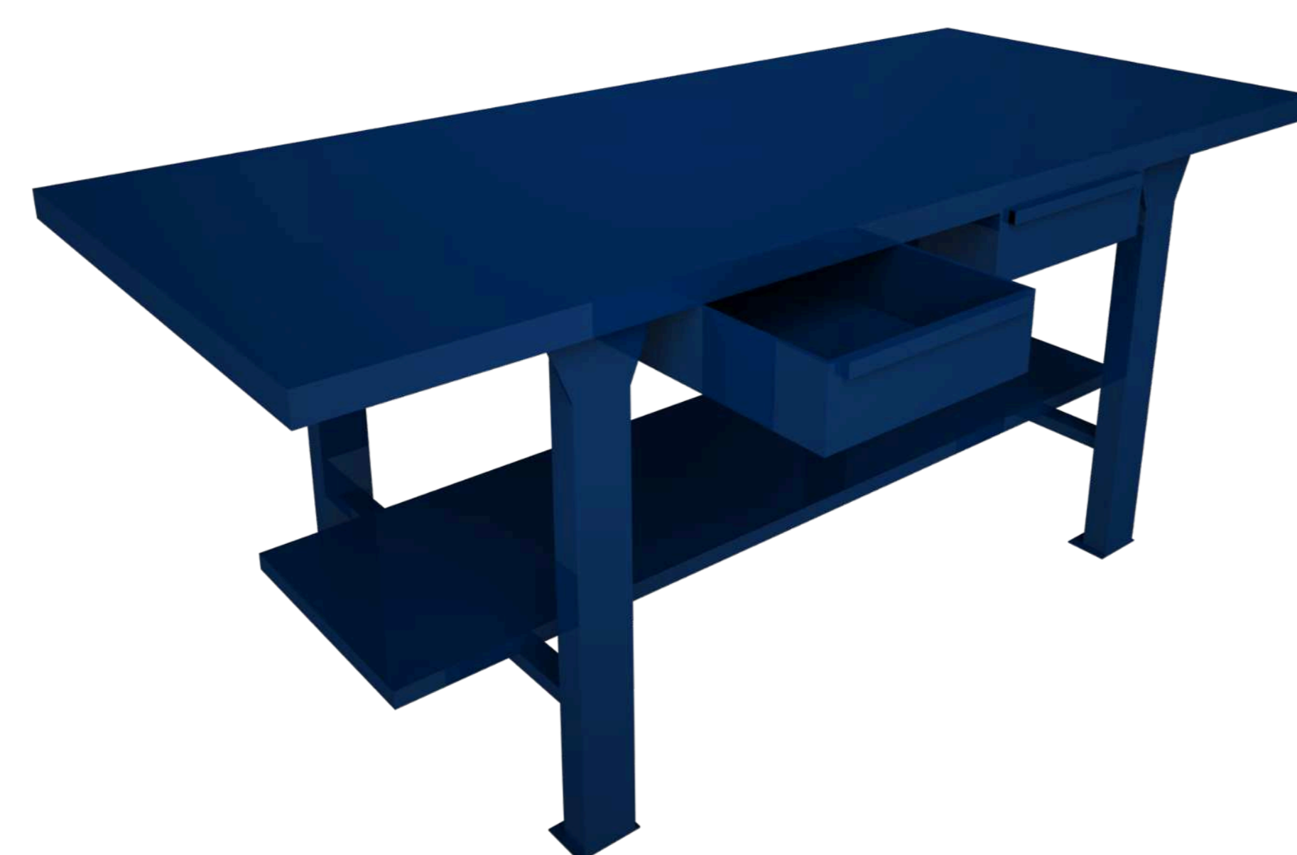
Banco de trabajo