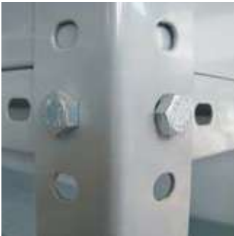
Detalle enganche con tornillos

Gracias a su estructura modular, las estanterías cuentan con un montaje sencillo, además es posible añadir tantos módulos como se requieran, incluso de distintas dimensiones.