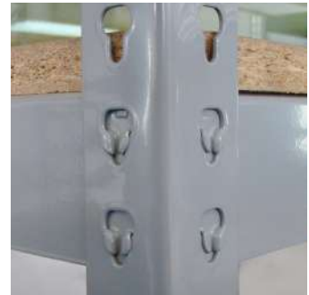
Detalle enganche con travesaño