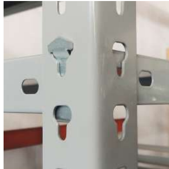
Detalle enganche de bandeja